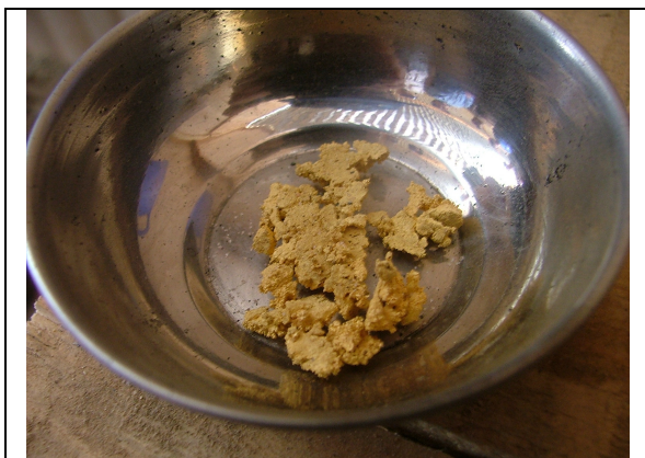
Imagen 1: Oro Refogado

Los productores de mayor escala, incluso algunos artesanales, prefieren eliminar la comisión de los intermediarios y vender directamente el oro al trader.