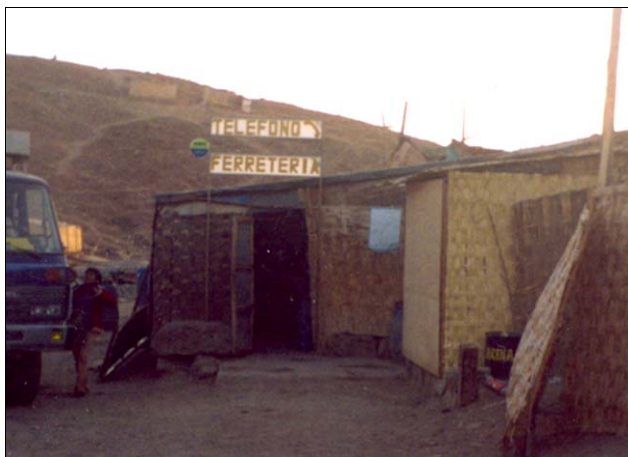
1. Local en donde se encuentra ubicado el teléfono público