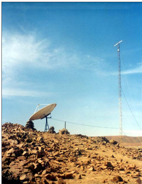
5. Desde hace aproximadamente 3 años atrás Santa Filomena cuenta con una antena parabólica que les permite tener acceso a la TV.

La comunidad de Santa Filomena solo tiene acceso a un canal de televisión: Andina de Radiodifusión (canal 9) pues los demás canales requieren un pago por derecho de transmisión. ATV (canal 9) es transmitido mediante una antena parabólica que lleva ya aproximadamente 3 años en la comunidad. La comunidad tomó la decisión de adquirir con sus propios recursos este equipo porque tenía la necesidad de estar informado, y a la vez tener un medio con el cual entretenerse en sus ratos libres. Con el fin de comprar la antena toda la comunidad aportó con su dinero; posteriormente el equipo fue cambiado y SOTRAMI se encargó de adquirir uno nuevo desde ese entonces son ellos quienes lo manejan y le dan mantenimiento.