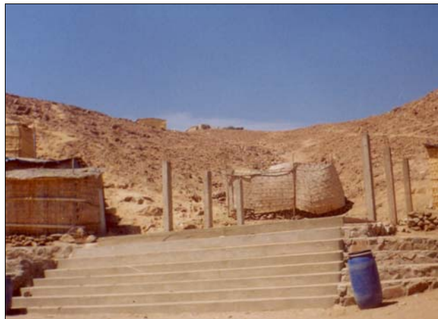
6. Santa Filomena no cuenta con un local comunal sin embargo tiene un espacio donde se reúnen.

Santa Filomena no cuenta aún con un local donde realizar las reuniones de comunidad, por eso cuando es necesario debatir, opinar o conversar acerca de algún tema se convoca a los pobladores por altoparlantes y se agrupan en el Sector 4 donde hay una