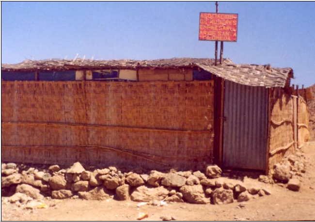
11. La Asociación de Mujeres Empresarias cuenta ya con un local de reuniones.