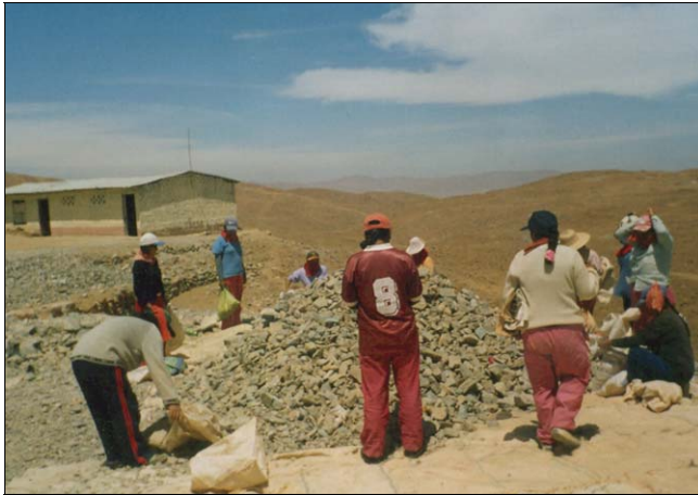
7. Mujeres pallaqueras se han agrupado en pro de su desarrollo en temas de seguridad y de mejora económica.