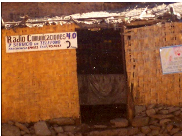
3. En Santa Filomena existe en total 5 locales que brindan el servicio de radio comunicación.