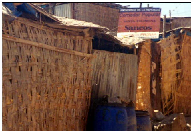
10. Local del comedor popular se encuentra cerrado hace más de un año.

El club de Madres fue fundado el 16 de julio del año 1996 pensando en que era sumamente importante que las mujeres de la comunidad estén organizadas y participaran en asuntos del pueblo.